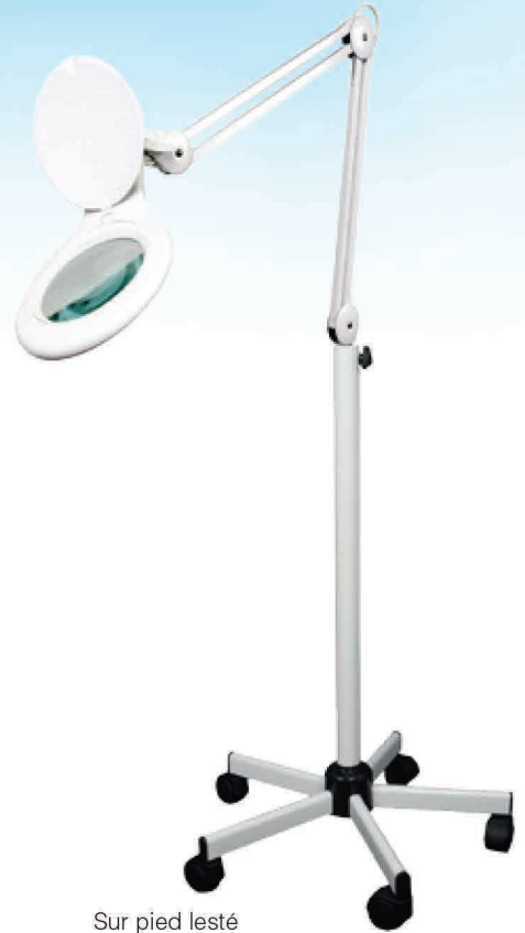
Sur pied lesté

Le bras articulé métallique et la rotule, permettent un bon ajustement. La loupe est avec capot de protection, une pince étau est fournie en standard.