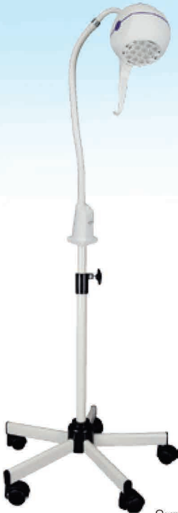
Sur pied télescopique lesté (1)

En option un deuxième interrupteur sur la tête de lampe permet d'ajuster l'intensité lumineuse : 50 ou 100 %